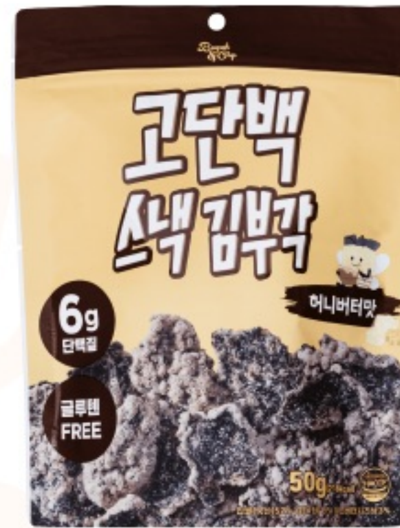
허니버터 맛 (50g)