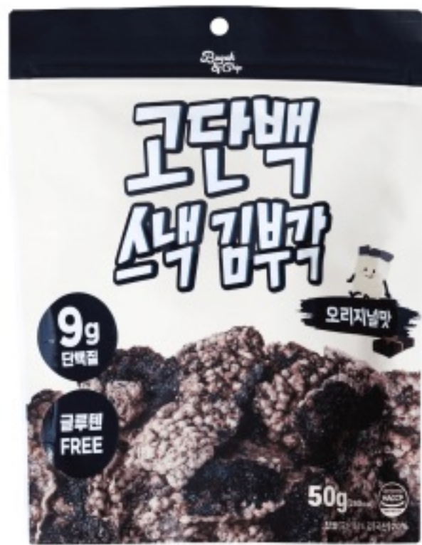
오리지널 맛 (50g)