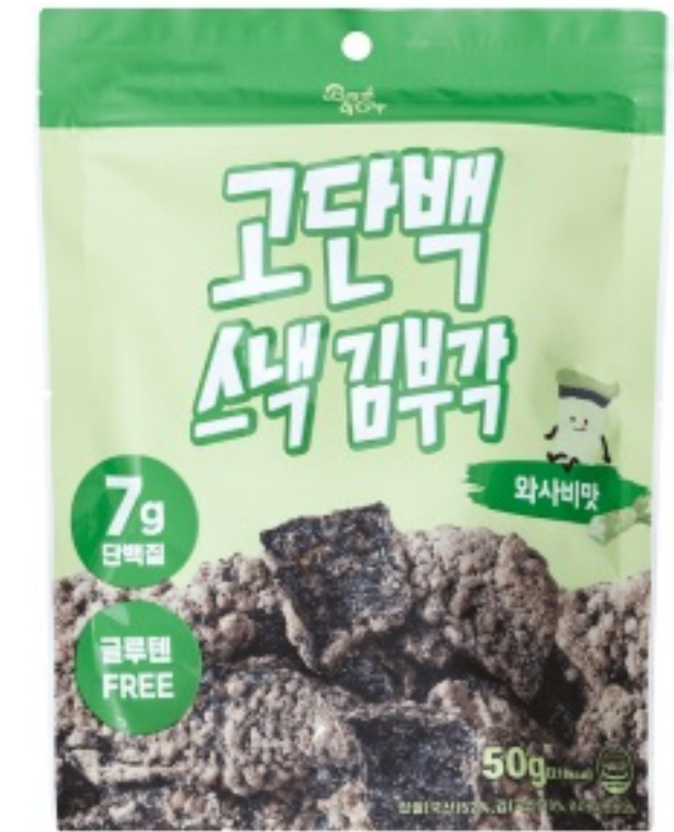
와사비 맛 (50g)