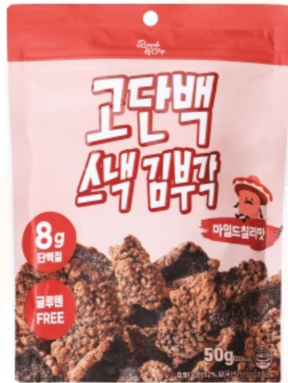
마일드칠리 맛 (50g)