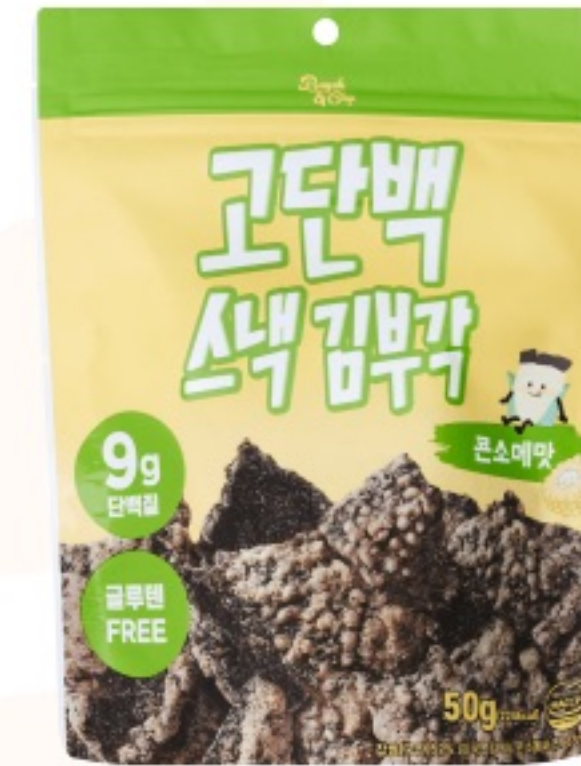
콘소메 맛 (50g)